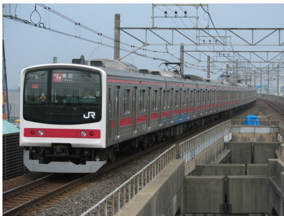
205系 通勤快速 東京行き