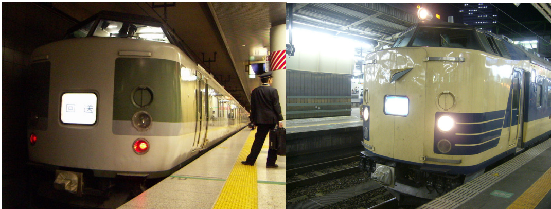
快速ファンタジー舞浜 東京にて 快速ムーンライト仙台・東京 仙台にて この2つは、過去の旅行で撮ったものです