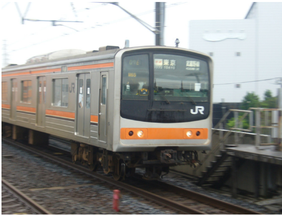
103系快速 府中本町行き 市川塩浜にて