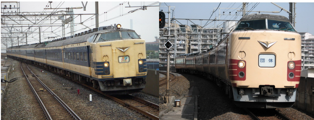
583系団体臨時列車 葛西臨海公園にて 183系団体臨時列車 潮見にて