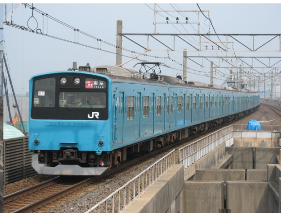
201系 通勤快速 東京行き 2つとも舞浜にて