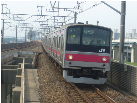
205系 快速 蘇我行き 舞浜にて