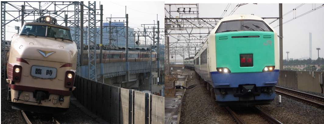
489系団体臨時列車 潮見にて 485系3000番台団体臨時列車 葛西臨海公園にて