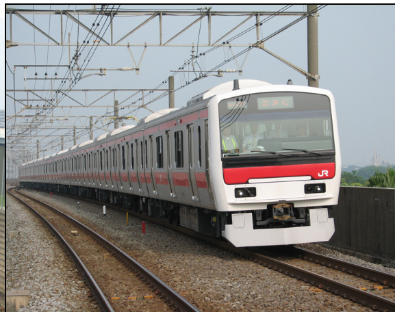
E331系 試運転 葛西臨海公園にて