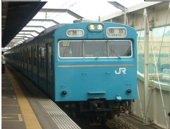
103系 各駅停車 東京行き