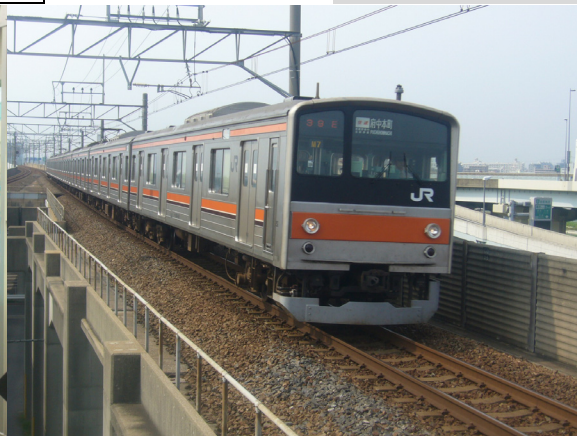
武蔵野線 205系 快速 府中本町行き 2つとも舞浜にて