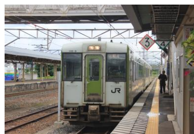
快速はまゆり2号盛岡行 花巻駅にて