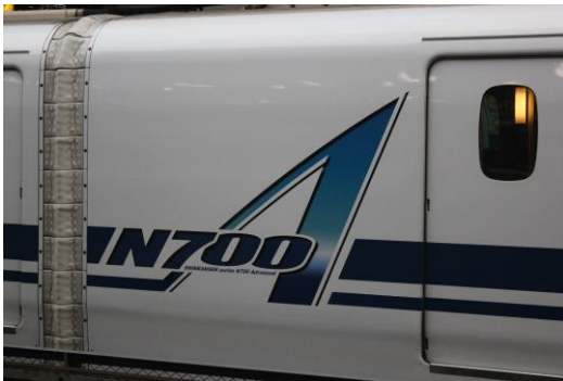
東京駅で見つけた N700 の A 編成

こんな文章と写真に付き合ってくれてありがとうございました。それでは、ここまで読んでいただいた方々ありがとうございました！