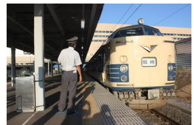
特急 ねぶたまつり号 新青森駅にて