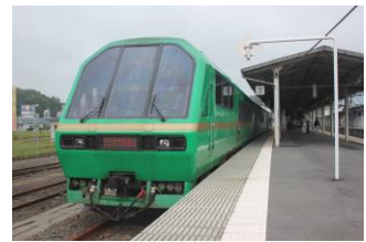
さんりくトレイン宮古号 宮古駅にて