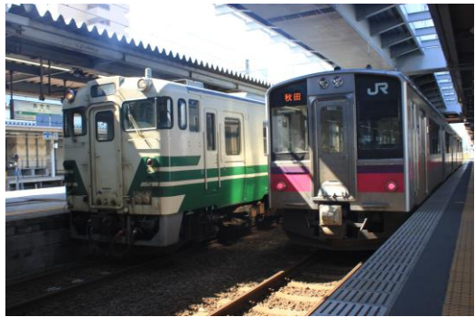
秋田駅に並んだキハ40と701系