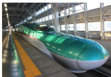
はやて48号 新青森駅にて