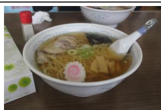
昼食のラーメン 店内にて

今回の旅では、唯一の普通電車乗車となる区間で車両は、Kenji と同じく盛岡車両センターの所属の701系だった。車内は時間帯のせいだろうか、地元の学生が多数乗っていたのと冷房が利きすぎてすごく寒すぎたこと位だった。(というか東北って夏はいつもこんな感じなのかなあ〜) 花巻までは、またさっきと同じく ipod で曲を聴きながら過ごした。そして花巻に着きトイレを済ませ、改札に向かう途中1番線にポケモントレインが停まって(※3)いた。そのあとは、旅館から呼んでおいた迎えの車で旅館に向かった。