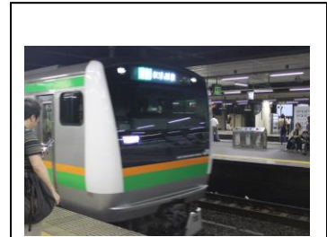
普通東京行き 川崎駅にて

座席は前から 3 番目の車両で普通車指定席にあたる 15 号車 7 番 A 席、つまり車両中央の窓側席だ。座席は少し硬くてリクライニングをしないと 3 時間はキツイ座席だった。