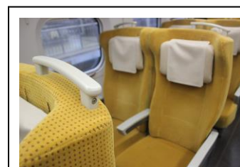
E6 系座席 (普通車) 車内にて