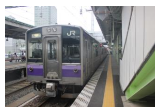
701系普通北上行き 盛岡駅にて