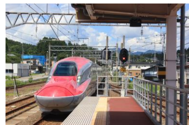
スーパーこまち7号 角館駅にて