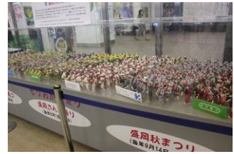
ミニチュア 盛岡駅にて

そしてしばらくして宮古駅に到着、宮古駅ホームから 釜石方面を見ると線路に車止め(※2)があり、いまだ に 3・11 の面影が残っていた。