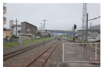
宮古駅ホームから釜石方 面を望む