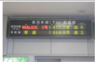
秋田駅ねぶたまつり号 電光掲示板