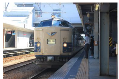
特急 ねぶたまつり号 秋田駅にて