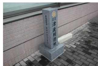
3・11 の際の津波到達の 石碑 駅前の銀行の脇