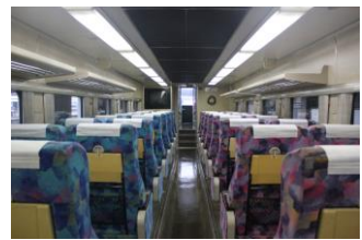
Kenji 車内 盛岡駅