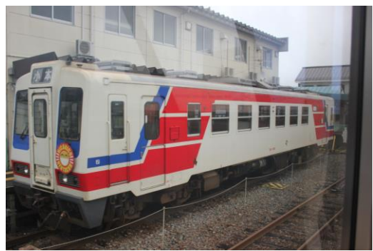
三陸鉄道 36 形