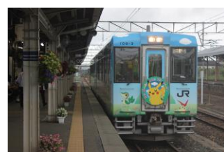
ポケモントレイン釜石号 回送 花巻駅にて