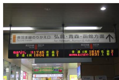
新青森駅ねぶたまつり号 電光掲示板