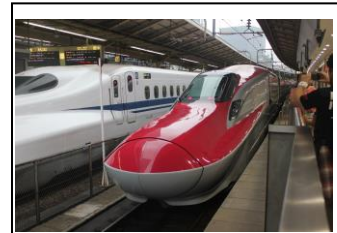
スーパーこまち 3 号 秋田行き 東京駅にて