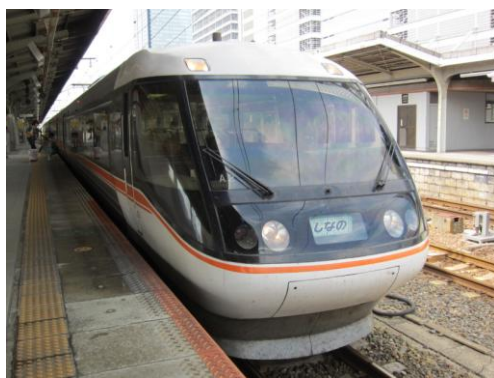
[特急]ワイドビューしなの 名古屋にて