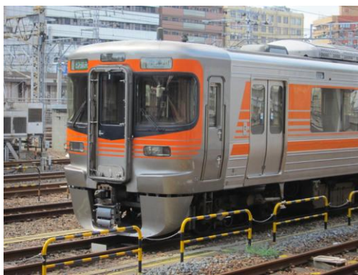
[快速]セントラルライナー 名古屋にて