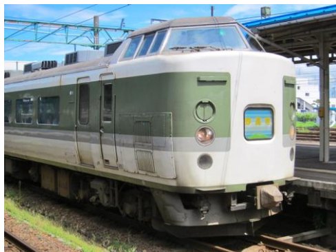
[普通]妙高 直江津にて