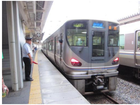
[新快速]東海道本線（225系） 石山にて