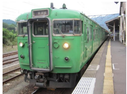
[普通]草津線 柘植にて