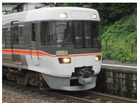
[特急]ワイドビューしなの 南木曽にて