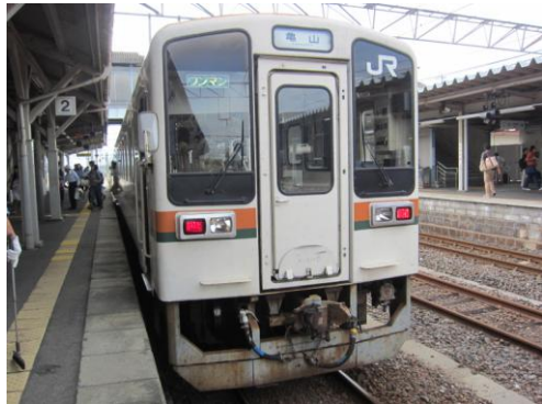
[普通]紀勢本線 亀山にて