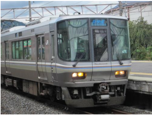
[新快速]東海道本線（223系） 石山にて