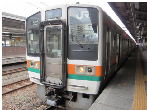
[快速]中央本線 名古屋にて