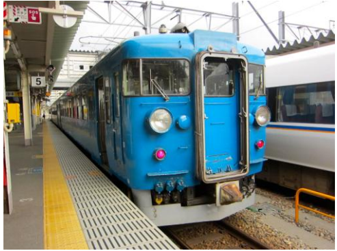
[普通]北陸本線 富山にて