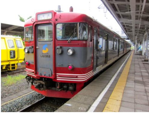
[快速]みすず 長野にて