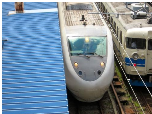
[特急]はくたか 直江津にて