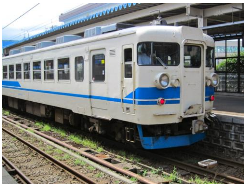
[普通]北陸本線 直江津にて