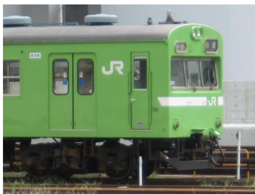
[回送]奈良線 京都にて