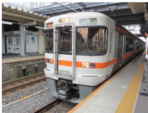
[新快速]東海道本線 大垣にて