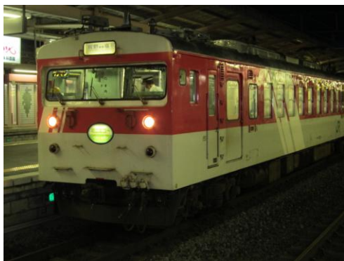
[普通]中央本線辰巳支線 塩尻にて