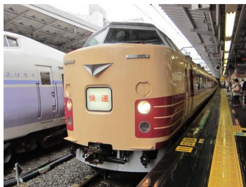
[快速]みたけ・おくたま探訪号 新宿にて