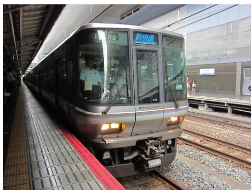
[新快速]東海道本線 京都にて