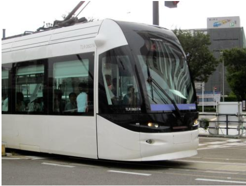
富山ライトレール 富山駅前にて