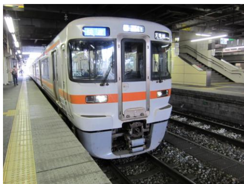
[普通]しなの鉄道 軽井沢にて