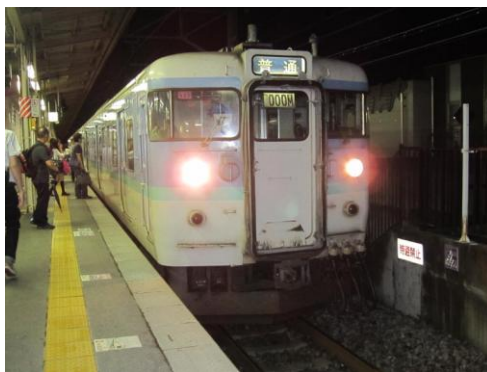
[普通]中央本線 塩尻にて