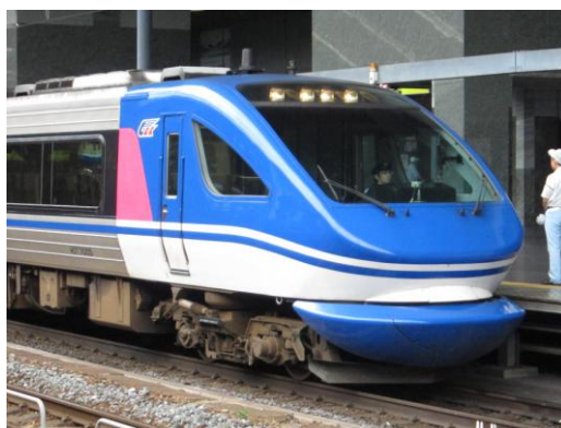
[特急]スーパーはくと 京都にて