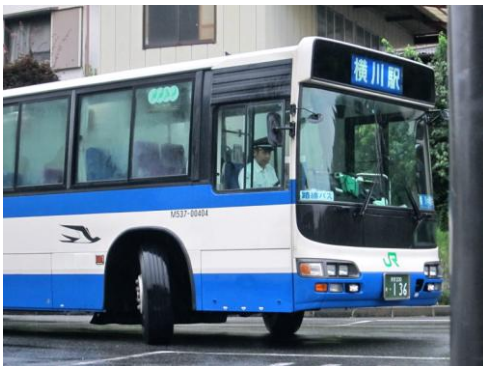
JR バス 碓氷線 横川にて