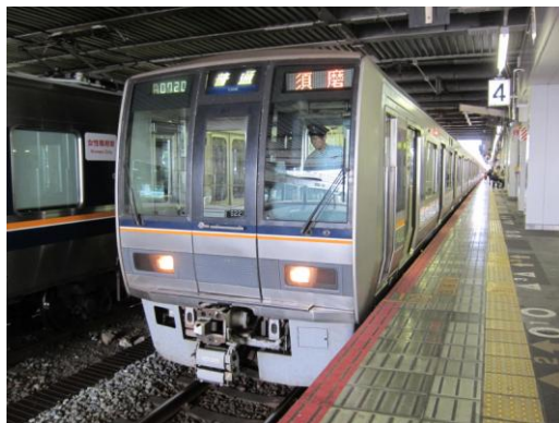
[普通]京都線 京都にて