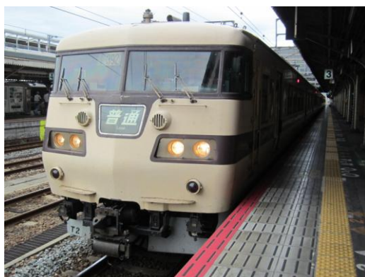
[普通]湖西線 京都にて