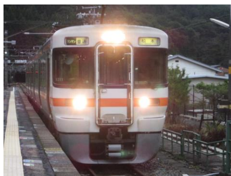
[普通]中央本線 南木曽にて