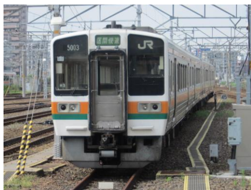
名古屋停車中の213系