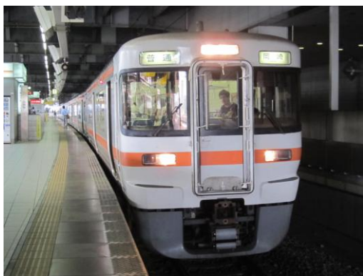
[普通]東海道本線 (313系) 名古屋にて