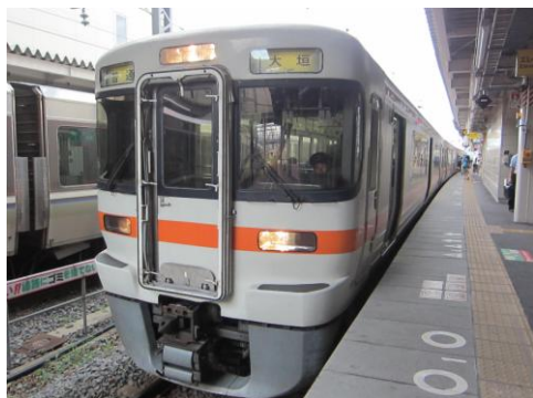
[普通]東海道本線 米原にて