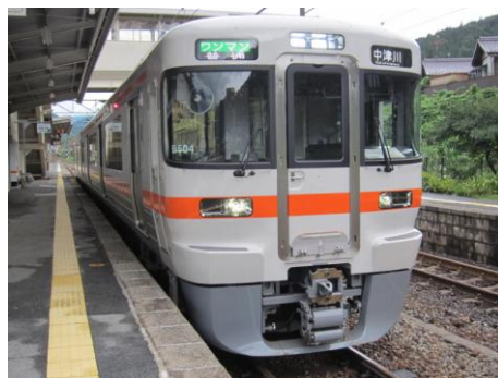
[普通]中央本線 南木曽にて