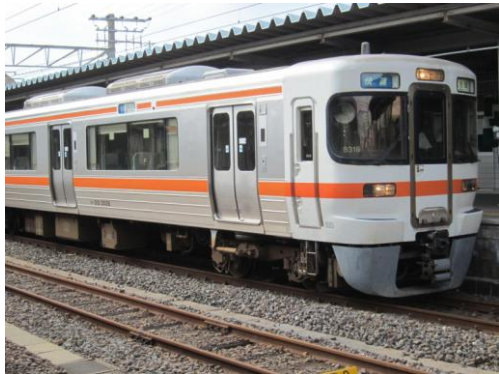
[快速]関西本線 亀山にて