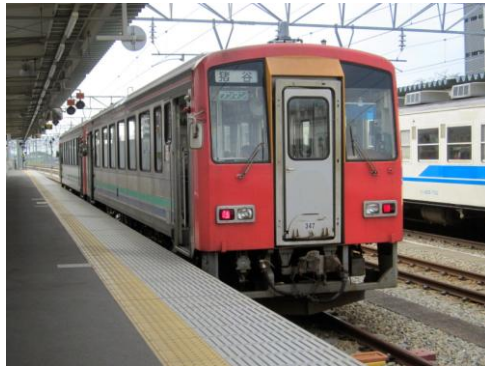
[普通]高山本線 富山にて