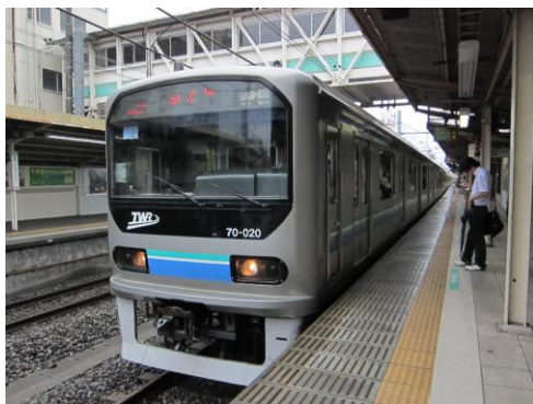
[普通]埼京線 十条にて