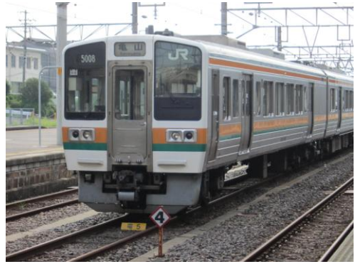
亀山停車中の 213 系関西本線