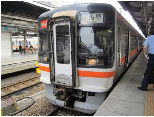
[快速]みえ 名古屋にて