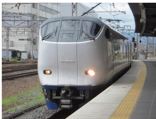
[関空特急]はるか 京都にて