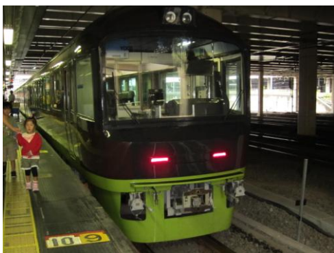
[特急]リゾート草津 新宿にて