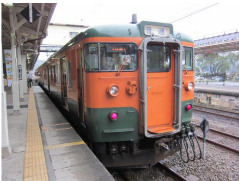
[普通]信越本線 横川にて