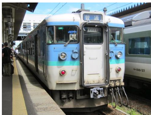
[普通]小海線 小諸にて