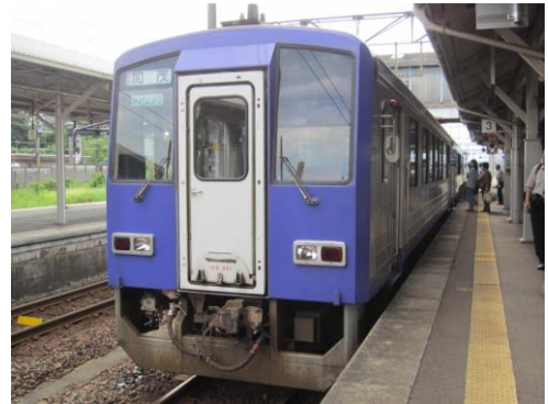
[普通]関西本線 亀山にて