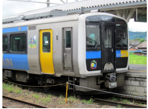
[普通]信越本線 直江津にて