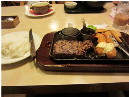
ココスのハンバーグ