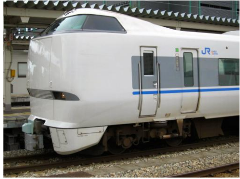
[特急]サンダーバード 富山にて