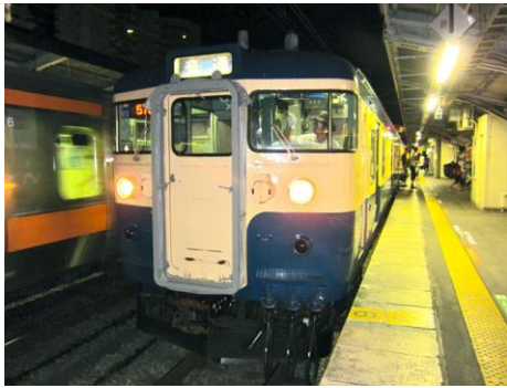
[普通]中央本線 高尾にて