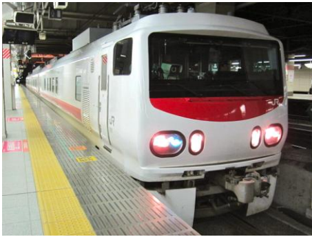
East-i E 新宿にて