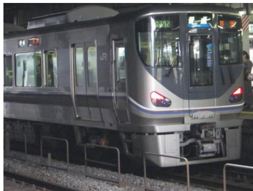
[新快速]東海道本線 京都にて