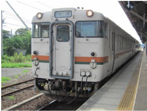
[普通]紀勢本線 亀山にて