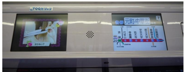
↑車内ドア上の TOQ ビジョン (15 インチ・全ドア上に設置)