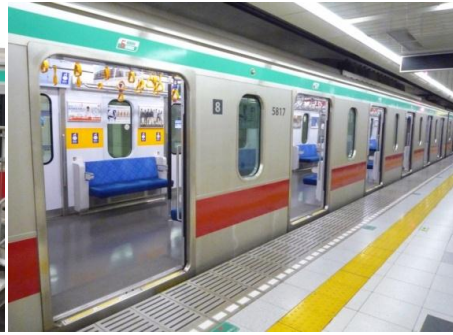
↑ 6扉車側面(サハ 5817)