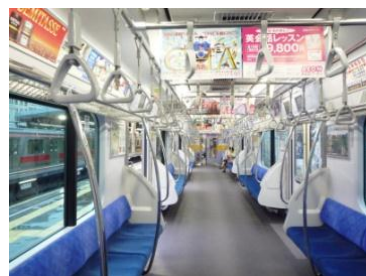
5000 系車内 ↑(4 扉車) ↓(6 扉車)