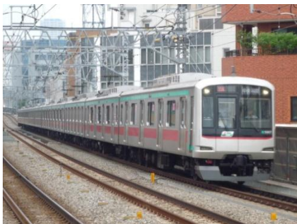
↑ 田園都市線を走る 5000 系 (溝の口にて)