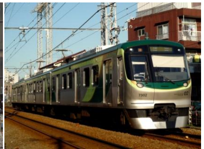
↑7000系(雪が谷大塚―御嶽山にて)