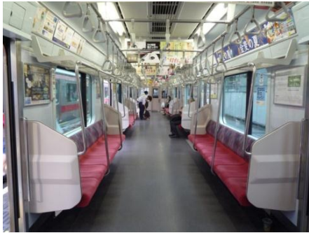
↑ 5050 系車内

2004 年より東横線用として投入し、現在 192 両が在籍。CS-ATC を装備。2012 年度を予定している東京メトロ・東武鉄道・西武鉄道への乗り入れに対応するため、ATO・東武型 ATS・西武型 ATS やワンマン運転機器の設置などの改造を行っている。制御装置は 5000 系と同様のものを使用している。車内はパステル調の配色で、定員は先頭車で 142 人、中間車で 153 人となっている。車外の方向幕は、一部編成を除き種別はフルカラーLED・行先は白色 LED となっている。