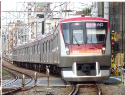
↑6000系(自由が丘―九品仏にて)