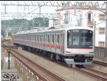
↑目黒線を走る 5080 系 (新丸子にて)

2003 年より目黒線用として投入し、現在 60 両が在籍。CS-ATC・ATO・TASC(定位置停車支援装置)を装備。制御機器は東芝製の SVF065 を使用し、主電動機も東芝製の TKM-99 となっており、他の 5000 系と少々異なる。車内は赤系の配色で、定員は先頭車で 142 人、中間車は 153 人となっている。ドア上の案内装置は、初期車では発光ダイオードのものが、後期車ではフルカラーLCD が採用されている。車外の方向幕は、初期車では種別・行先共に 3 色 LED とし、後期車では種別はフルカラーLED・行先は白色 LED としている。