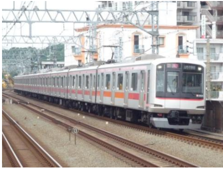
↑東横線を走る 5050 系 (新丸子にて)