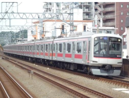
↑ 東横線を走る 5000 系 (新丸子にて)

2002 年より田園都市線用として投入し、現在 212 両が在籍。東京メトロ・東武鉄道への直通運転対応のため、CS-ATC と東武型 ATS を装備。2005 年より混雑緩和と乗降時間短縮のため 6 ドア車の投入を始め、一部の編成において組み換えが行われた。また、2009 年度より、6 ドア車導入によって余剰となった車両が東横線に転用され、現在 4 編成が元住吉検車区に所属している。制御装置は日立製作所製の XF1-HR2820B を使用している。車内は青系の配色とし、定員は先頭車で 140 人、中間車は 4 扉車で 151 人、6 扉車で 155 人となっている。車外の方向幕は、初期車では種別は字幕・行先は 3 色 LED とし後期車では種別はフルカラーLED・行先は白色 LED としている。