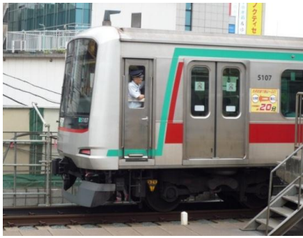
↑ 5000系先頭車側面(クハ 5107)