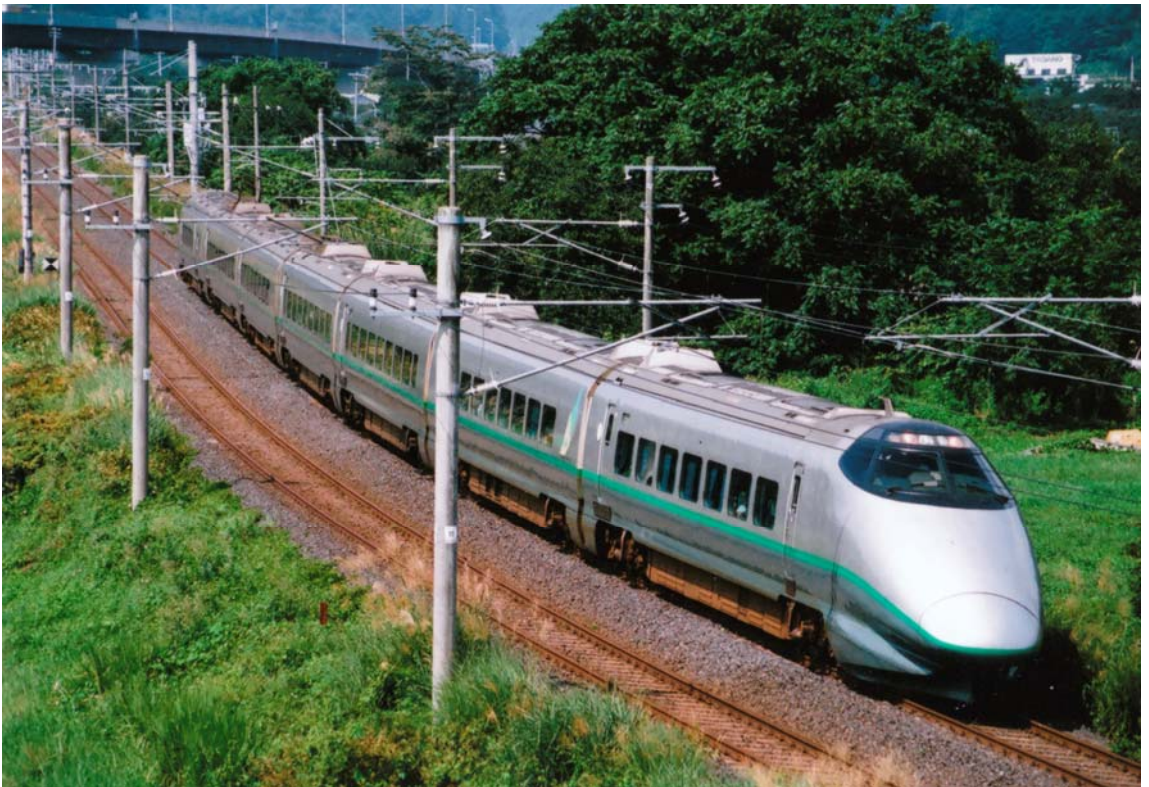
▲つばさ 105号 10:48頃 詳細データ不明 ISO400 Kodak SUPERGOLD