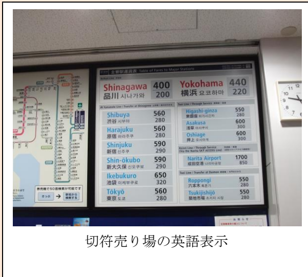
切符売り場の英語表示