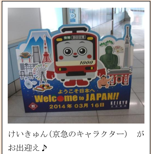
けいきゅん(京急のキャラクター) が お出迎え♪