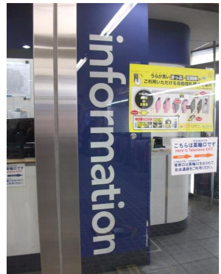
インフォメーション