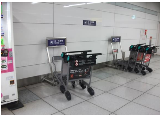
カート置場（ホームにある）