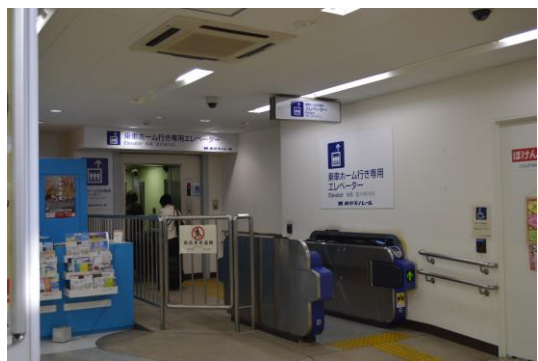
ホーム行エレベーター