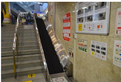
キャリーバック用コンベア