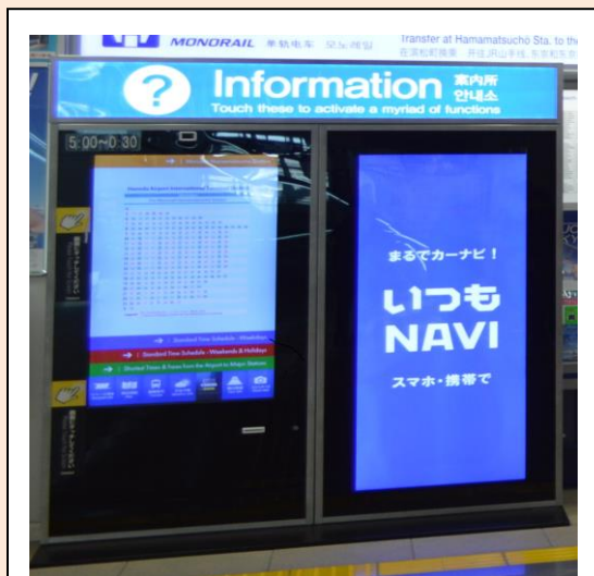
タッチ操作できるインフォメーション