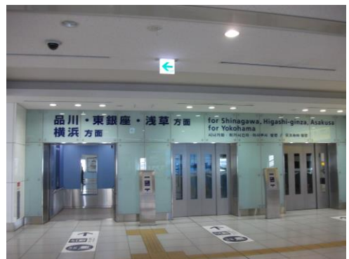
大型エレベーター